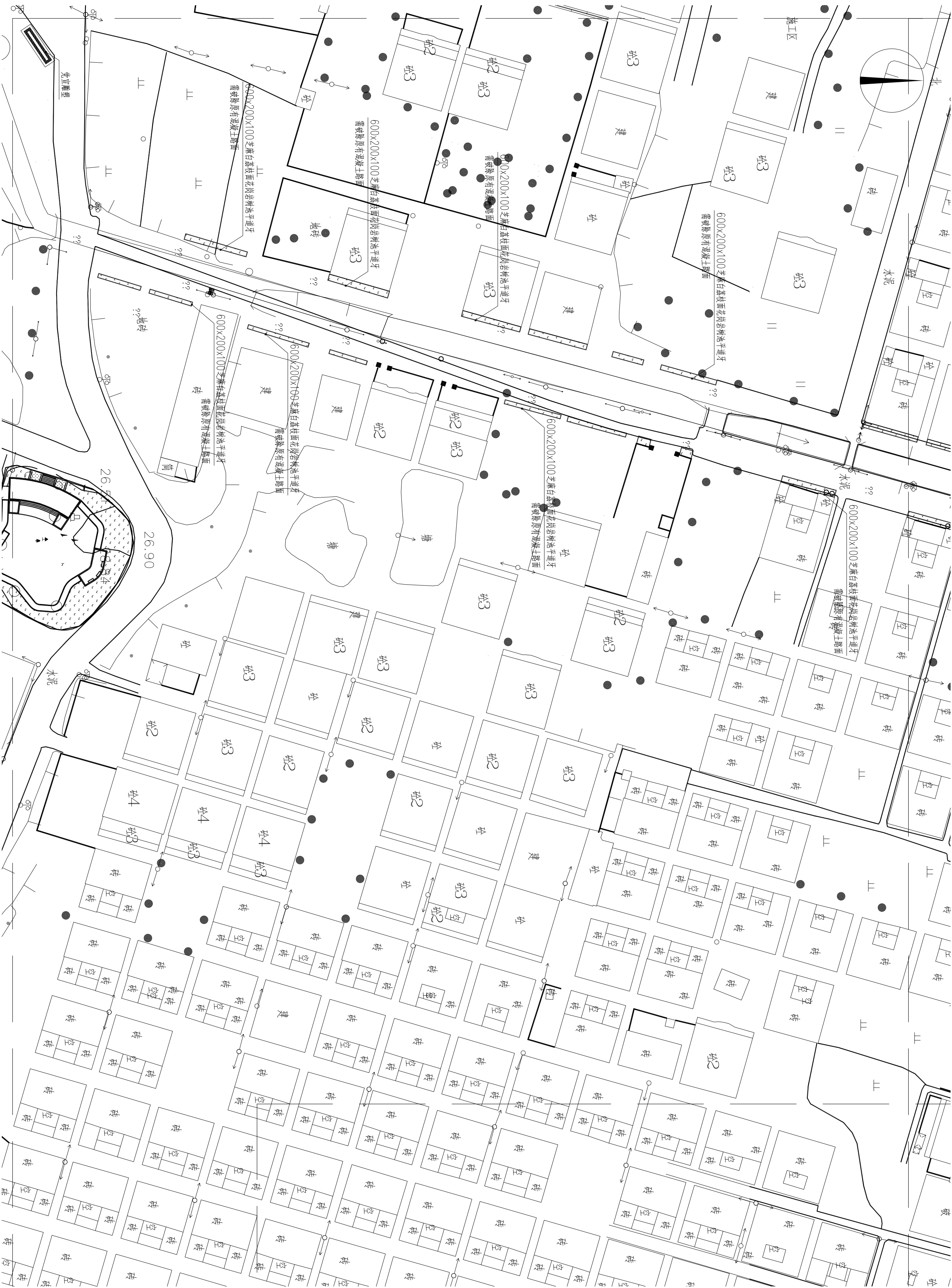
分区铺装及索引平面图八 1:600