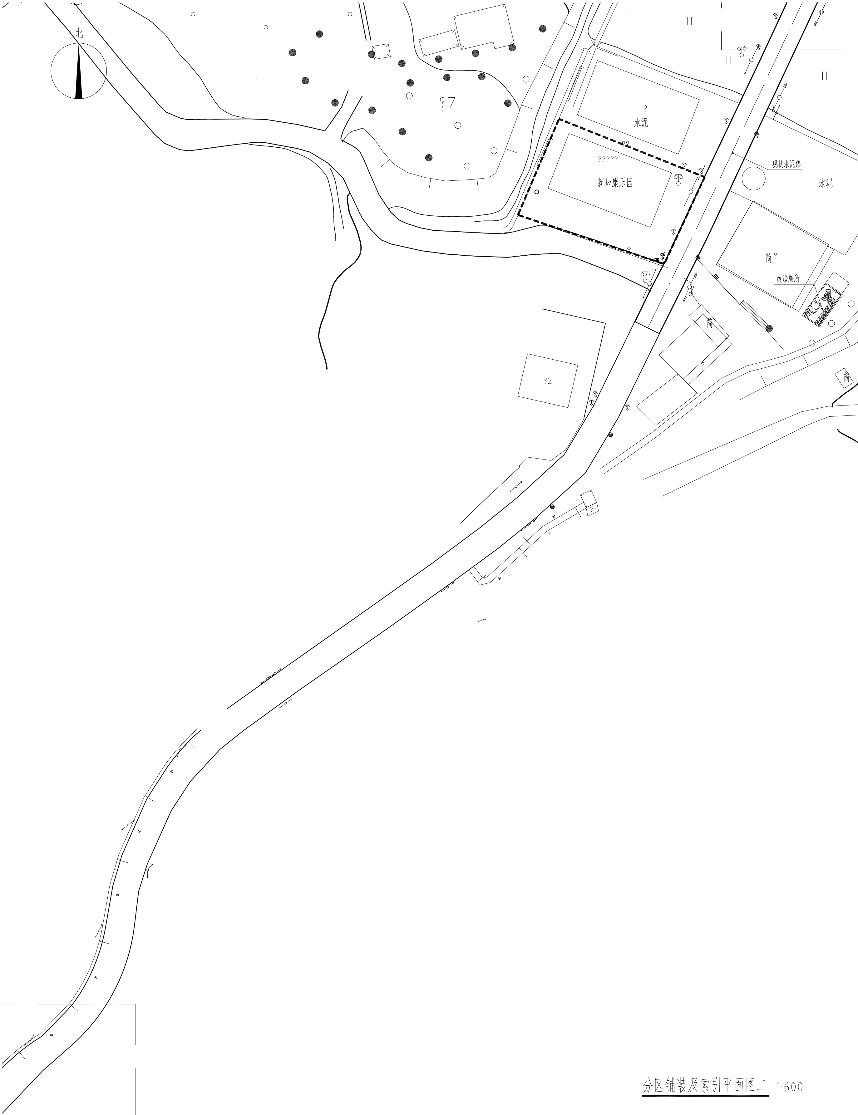
分区铺装及索引平面图二 1:600