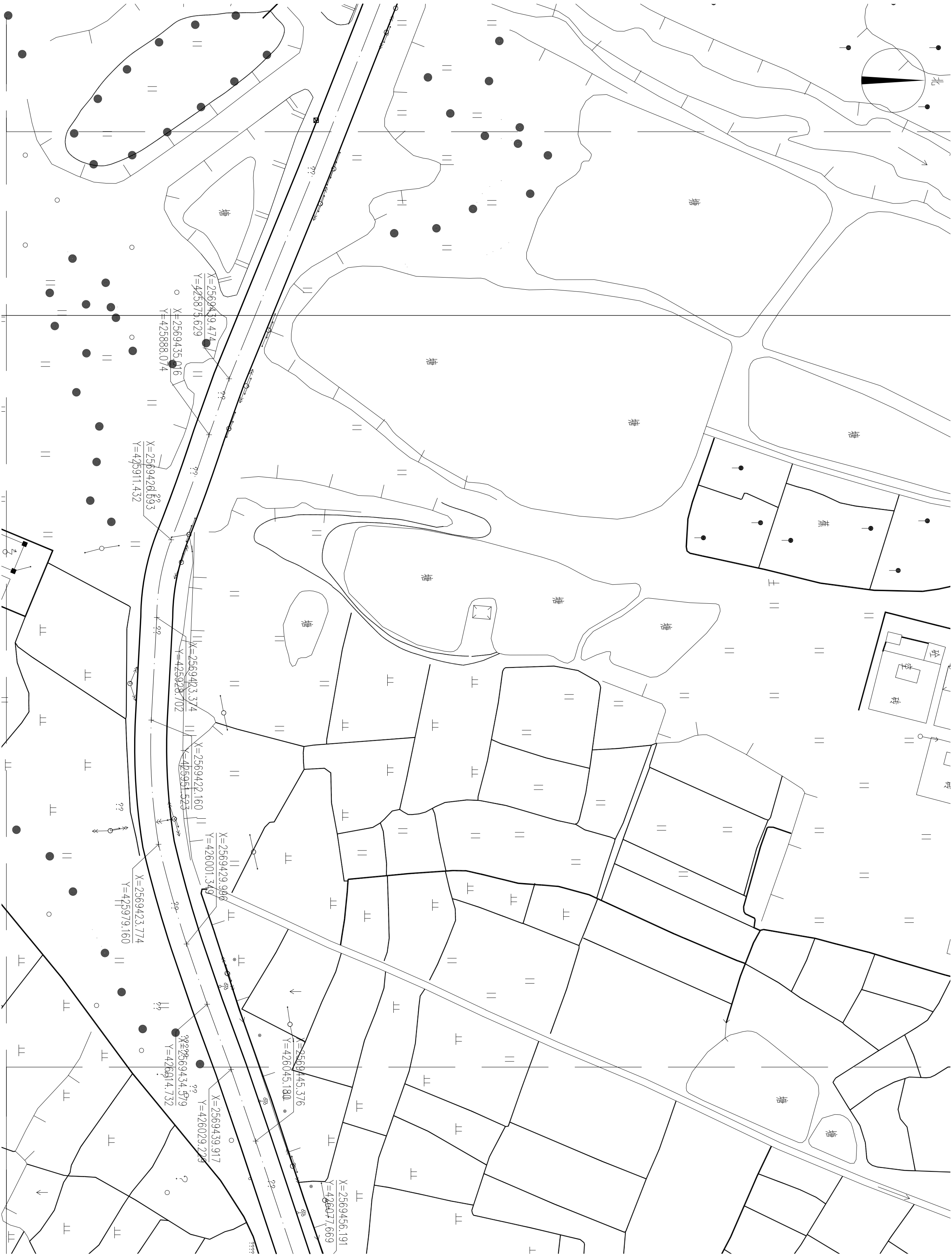
分区坐标放线平面图 1:600