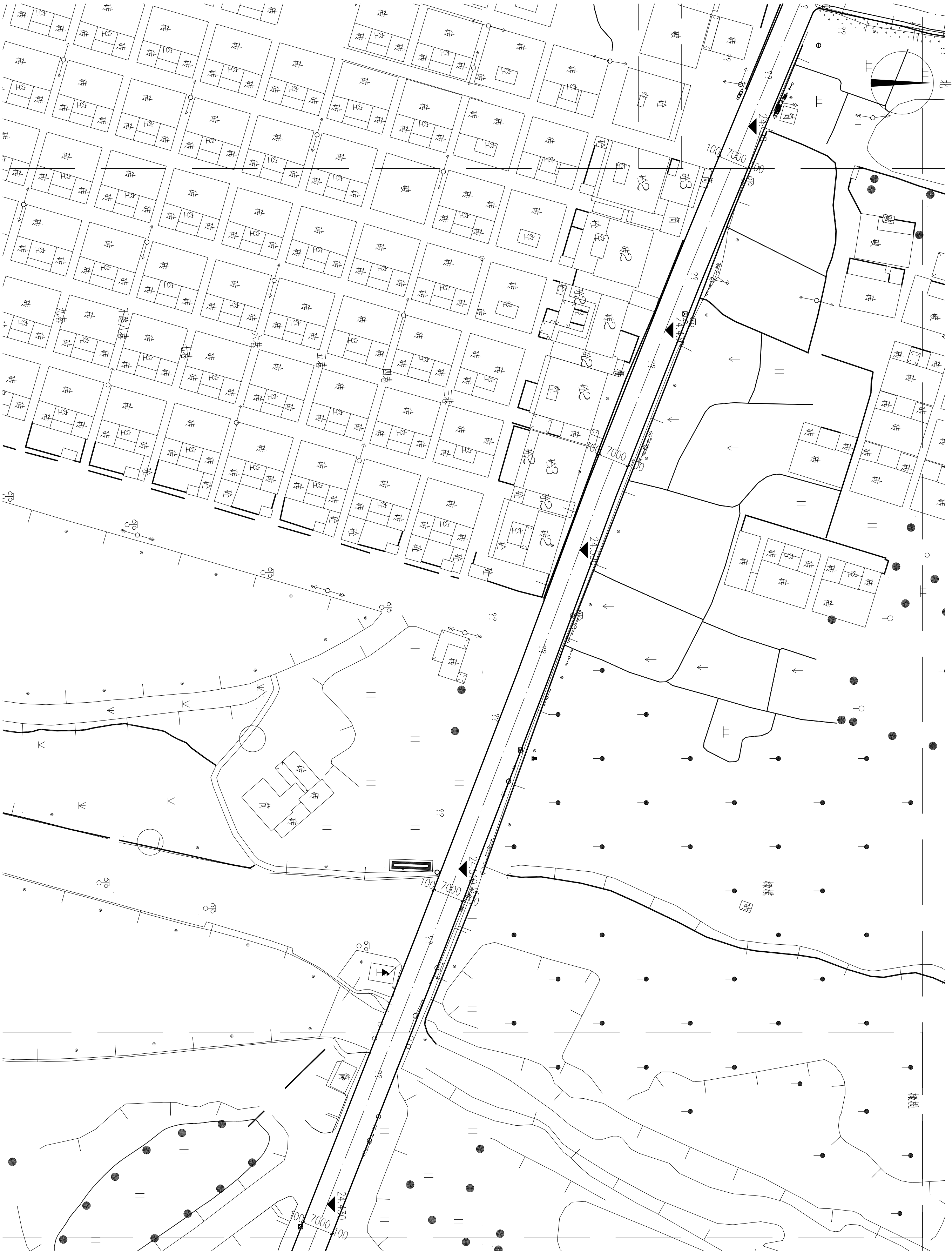
分区尺寸及竖向平面图九 1:600