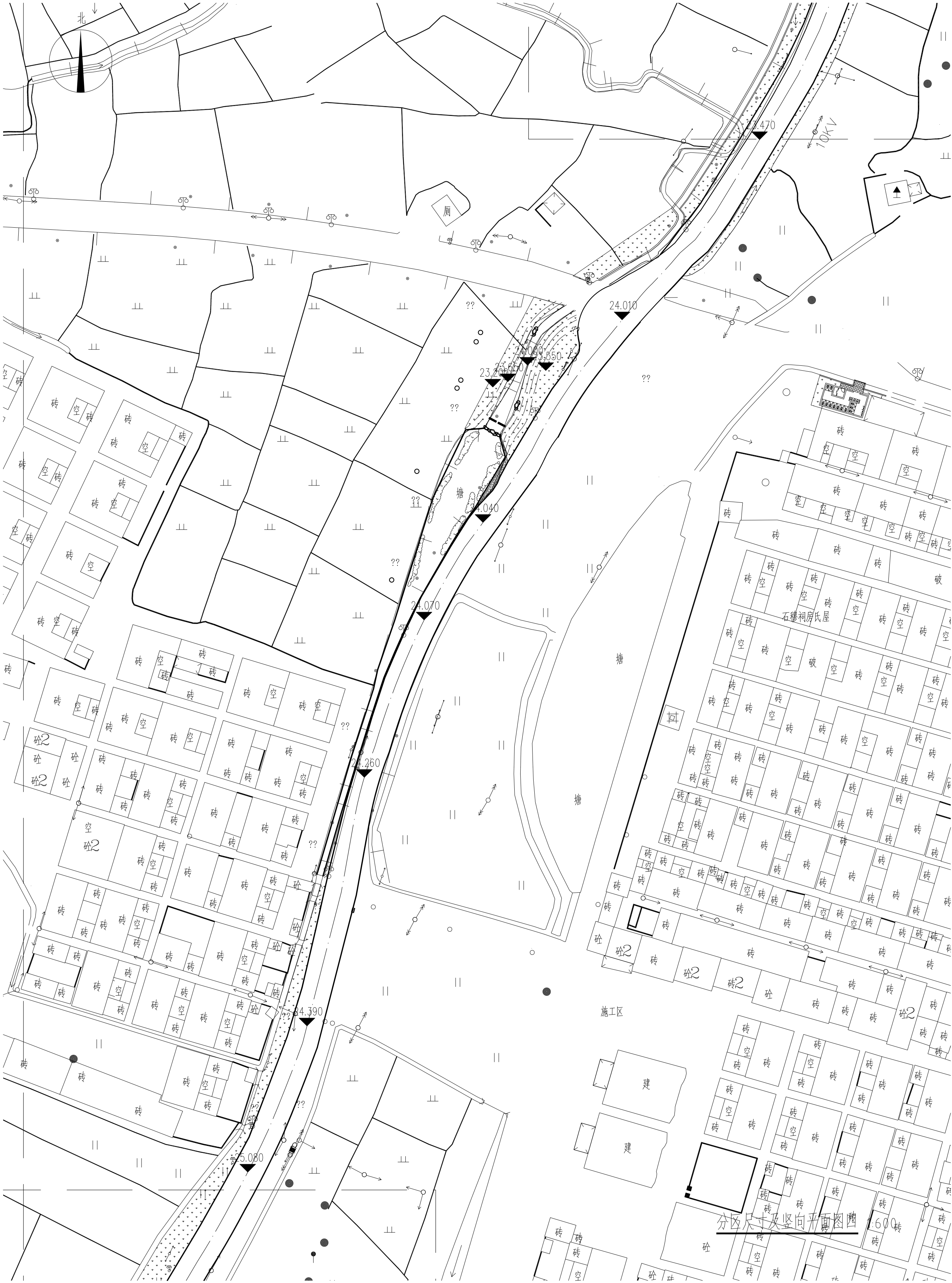
分区尺寸及竖向平面图