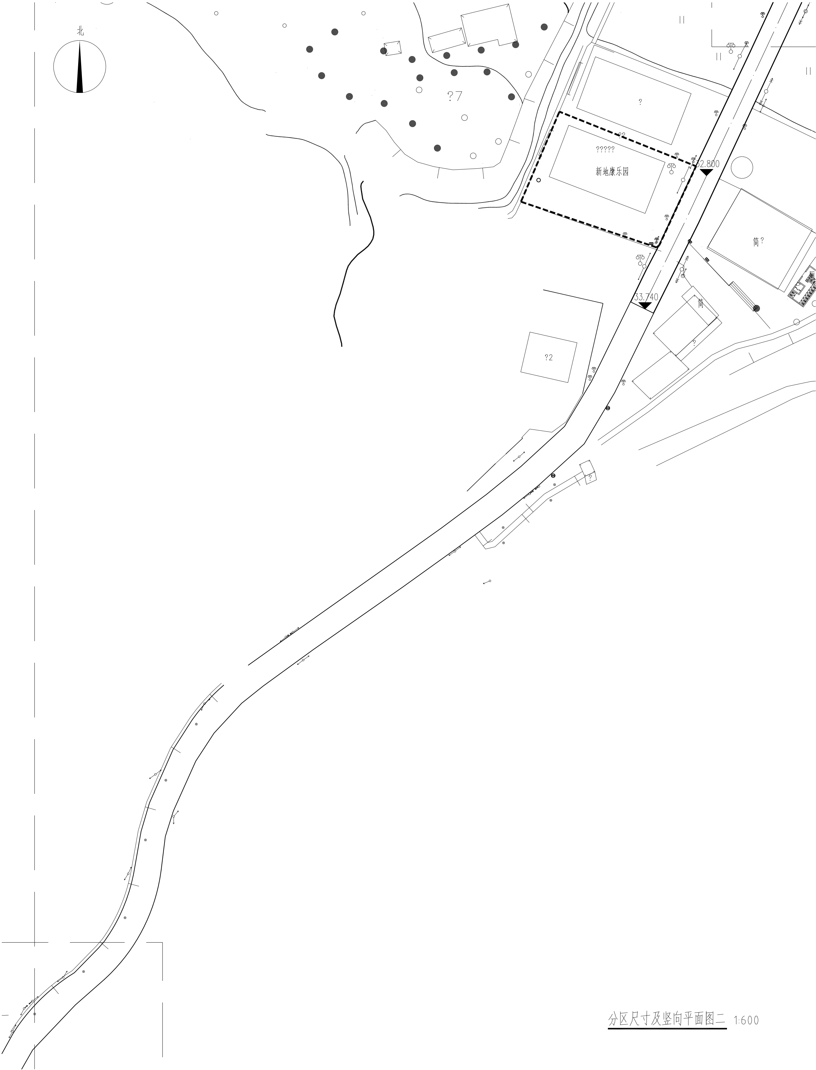
分区尺寸及竖向平面图二 1:600