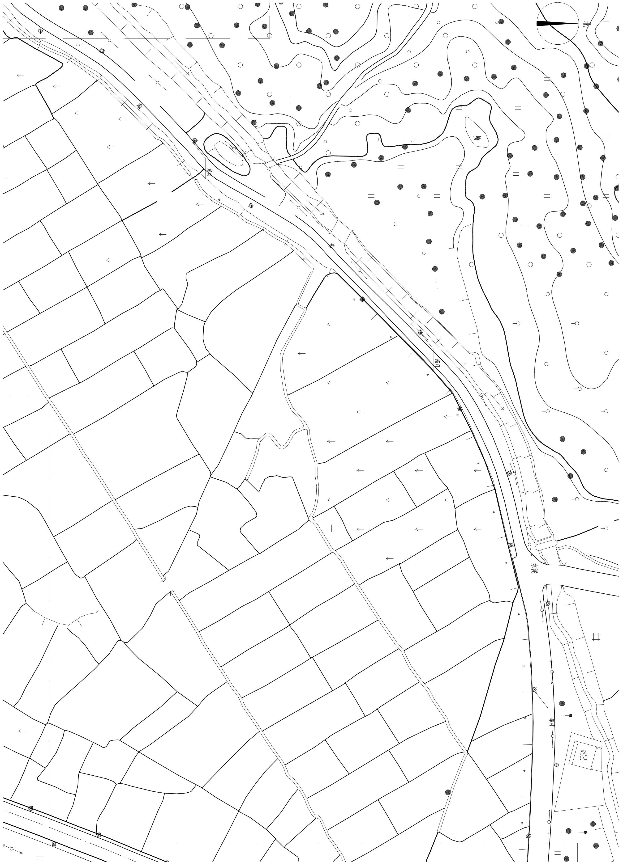
路灯点位平面图四 1:600