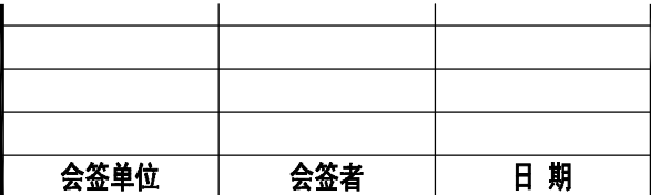
会签单位 会签者 日期