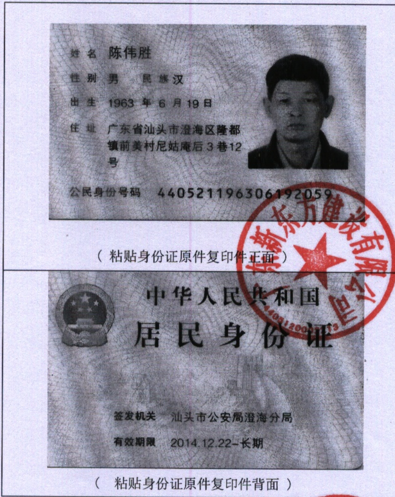
( 粘贴身份证原件复印件正面 )