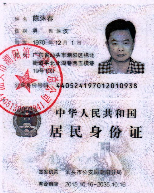
法定代表人身份证复印件