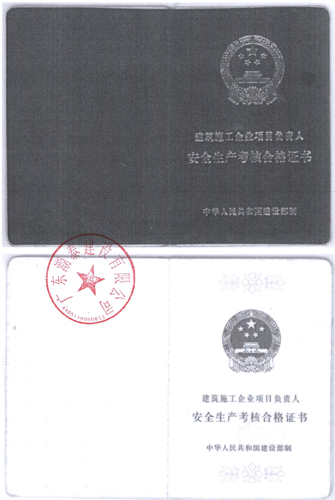
安全生产考核合格证（B类）复印件