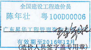
(造价人员签字盖专用章)