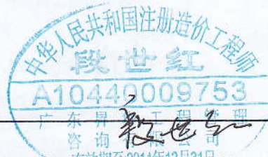
(造价工程师签字盖专用章)