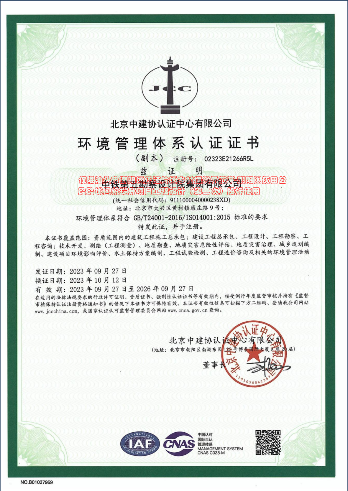
附：环境管理体系认证证书